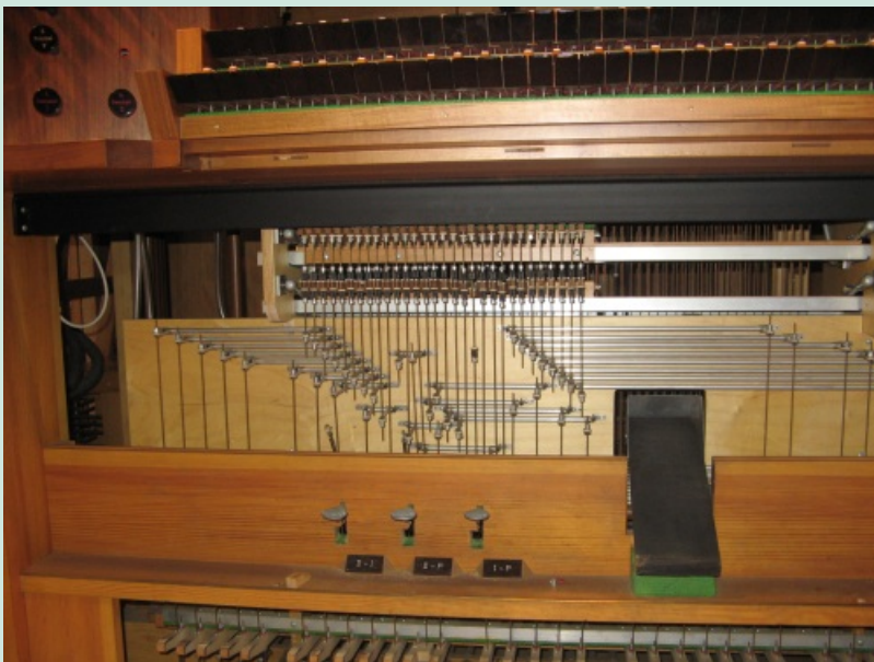
Der neu intonierten Orgel der Thomaskirche ins Innere geblickt. Blick auf Spieltisch mit den mechanischen Trakturen (Verbindung zwischen Taste und Pfeifenventil).