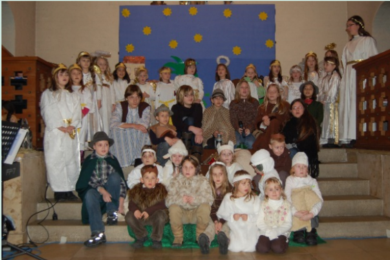
Zeit für Engel – Kinder des Rabenchors beim Krippenspiel 2010