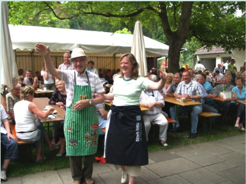
Gemeindefest Stephanus – 2011 muss es leider wegen des Gemeindehausabbrisses und -neubaus entfallen!